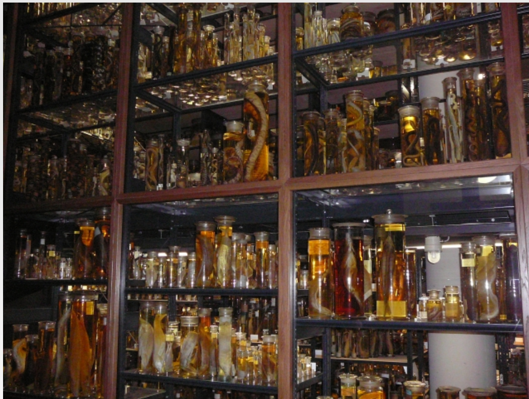
Foto: Studijní cesta na konferenci Global Genome Biodiversity Network (GGBN) spojená s bilaterálním setkáním s norským partnerem (Berlín, genetická banka živočichů)